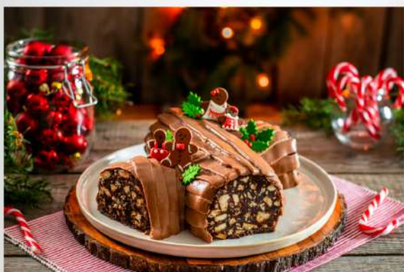
Salame al cioccolato